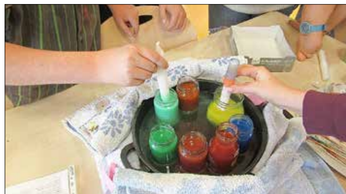
Kerzen farbig gestalten

Rasend schnell sind wir mitten im Advent gelandet. Traditionell stehen im Dezember viele Termine außerhalb des regulären Unterrichts auf dem Plan. Adventswerkstatt, Adventswanderung, Besuch im Theater und Beteiligung am Adventsmarkt vor dem zweiten Advent. Hier einige Impressionen: