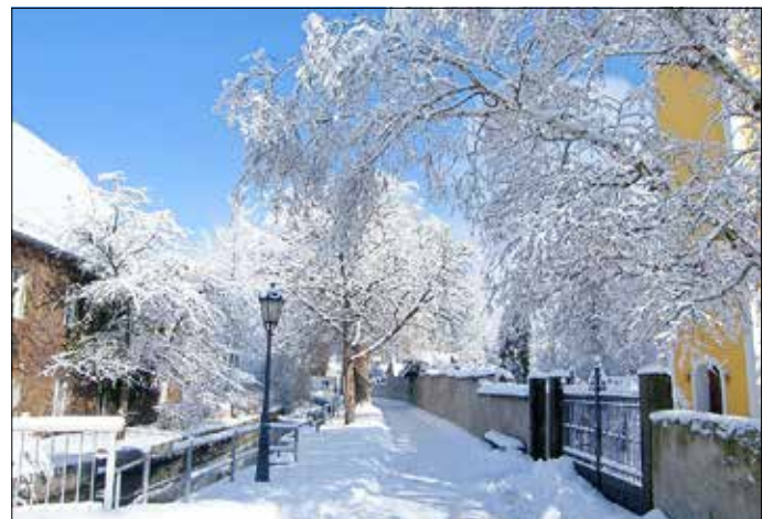
Februar 2009 – Kirchweg –