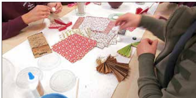
In der Adventswerkstatt