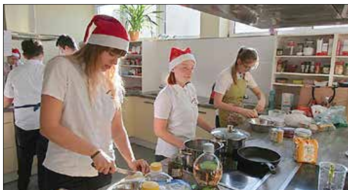
Kochen eines Weihnachtsmenüs

Wir wünschen Ihnen von Herzen eine gesegnete Weihnachtszeit, ein zufriedenes Nachdenken über Vergangenes, ein Glaube an das Morgen und Hoffnung für die Zukunft. Bleiben Sie behütet.